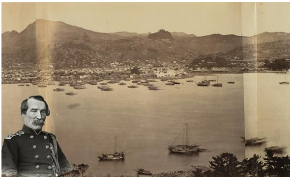
Nagasaki Harbor gefotografeerd in 1861 tijdens de Pruisische East Asian Expedition

De grootvader van Shinkichi, Tajiri Saheita (1813) was de tweede zoon van Fuugawa Jihueemon en werd in 1847 benoemd tot stamhouder van de familie Tajiri. Hij werkte voor de afdeling rijst. In de samoerai tijd werd rijst gebruikt als een betaalmiddel en werden bijvoorbeeld de jaarlijkse belasting en pachtrenten in rijst uitbetaald.